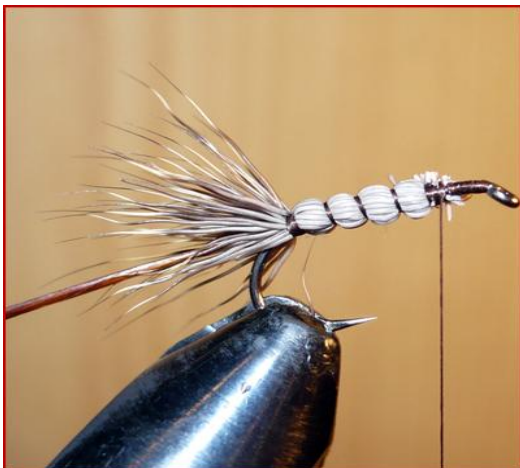
Etape 3 : Mettre les poils de chevreuil à plat sur la hampe et façonner l'abdomen avec la soie de montage, l'abdomen couvre les deux tiers du corps.