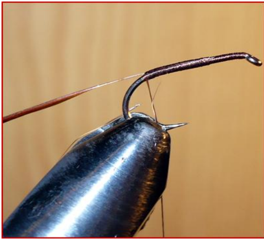
Etape 1 : Fixer à la courbure une petite plume de cou de coq roux.

Chevreuril naturel Plume de cou de faisan