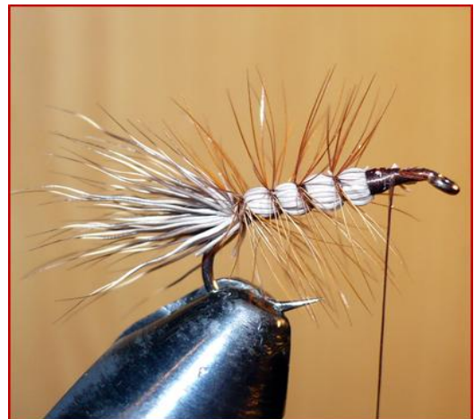
Etape 4 : Tourner la plume rousse en la faisant suivre les enroulements de la soie de montage autour du chevreuil.

A noter il est aussi possible de procéder de la manière suivante :