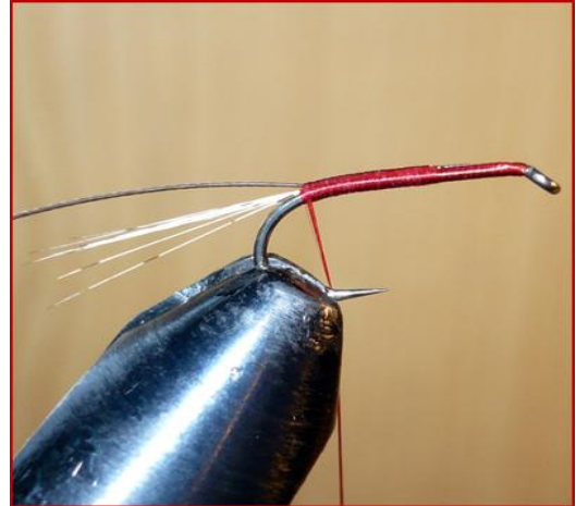
Etape 2 : fixer un rachis de plume de coq gris, roux ou noir par la pointe (côté le moins épais). Pour obtenir un rachis de plume de coq prendre une grande plume sur le cou et éliminer en tirant dessus (pas couper au ciseau) toutes les fibres. Attention le haut de la plume est souvent cassant, mieux vaut éliminer le dernier tiers du rachis.