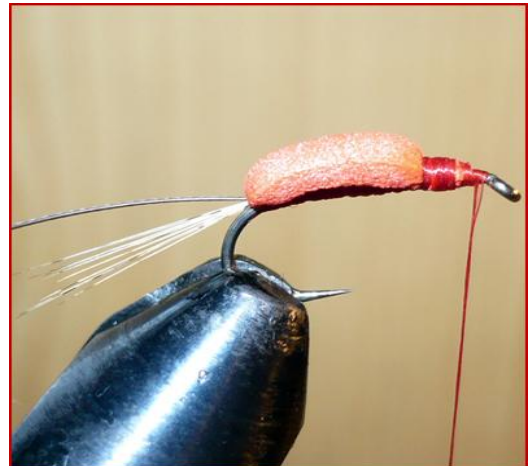
Etape 4 : rabattre la mousse et la fixer, il doit rester environ 1/3 de la hampe.