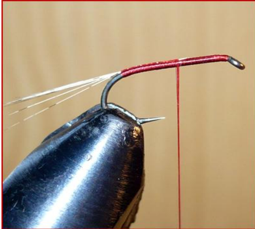
Etape 1 : fixer les cerques en pardo.

Matériel : Hameçon droit n°12 à 14 Soie de montage rouge ou orange, soie de montage noire Plume de coq pardo Mousse/Foam rouge 1mm d'épaisseur Rachis de plume de coq gris, roux ou noir Plume de coq gris ou roux