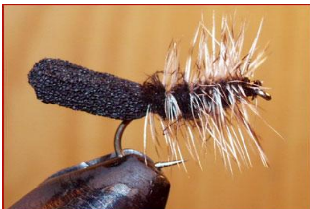
Etape 9 : faire une tête en sdm puis nœud final.