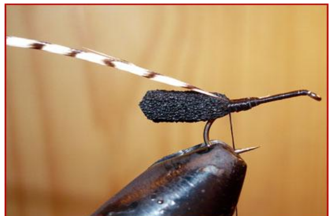
Etape 4 : fixer contre l'abdomen une plume de coq grizzly.