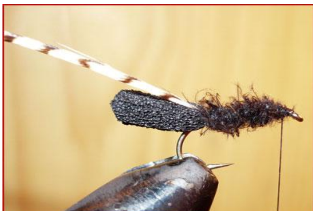
Etape 7 : tourner le dubbing jusqu'avant l'œillet. Eliminer au ciseau les fibres récalcitrantes.

Dubbing de cul de canard noir Plume de cou de coq grizzly