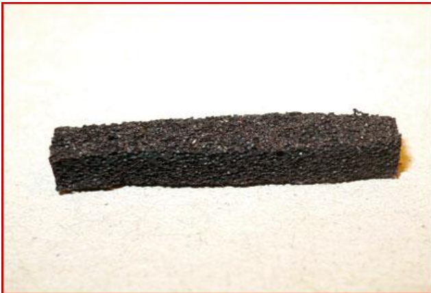
Etape 1 : découper un rectangle de mousse noire d'environ 1cm de long pour 1mm de large.

Dubbing de cul de canard noir Plume de cou de coq grizzly