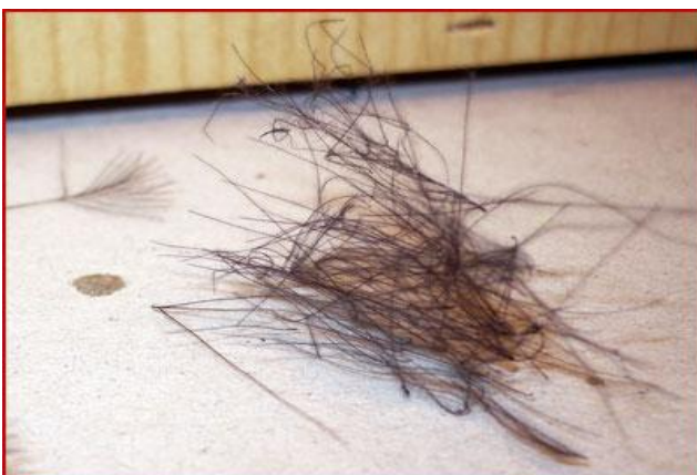
Etape 5 : préparer un dubbing en cdc = arracher les fibres sur une à deux plumes.