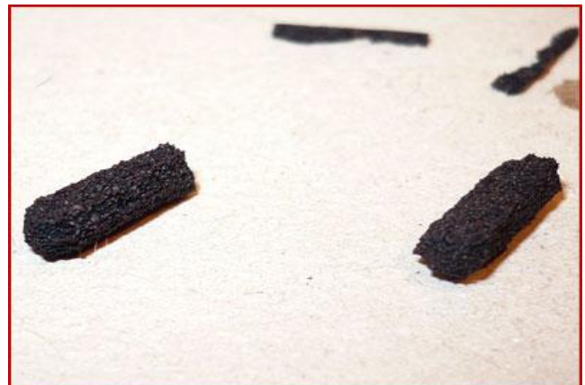
Etape 2 : arrondir angles et côtés avec un ciseau.