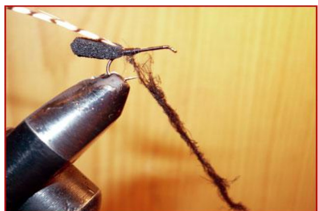
Etape 6 : vriller ce dubbing obtenu sur la soie de montage.