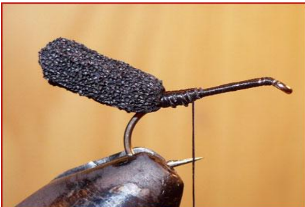
Etape 3 : fixer l'abdomen obtenu à la courbure.