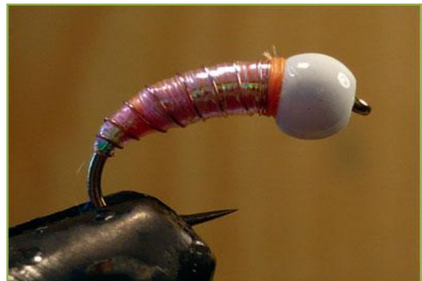
Etape 8 : cercler le corps ainsi obtenu avec le cuivre, fixer celui-ci contre la bille, faire un petit spot orange contre la bille avec la soie de montage. Faire le nœud final à l'arrière de la bille.