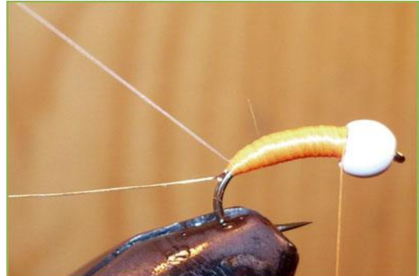
Etape 6 : fixer –en partant de la bille vers la courbure- un ou deux brin(s) de cristal flash ou équivalent rose, nacre ou orange fluo à la courbure.