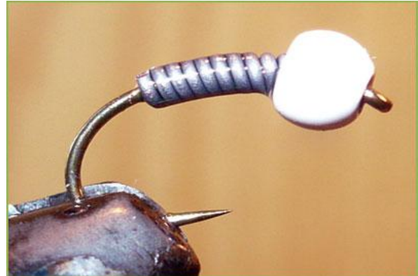
Etape 2 : enrouler du plomb sur les deux tiers de la hampe à partir de la bille, une goutte de colle extraforte l'empêchera de bouger.