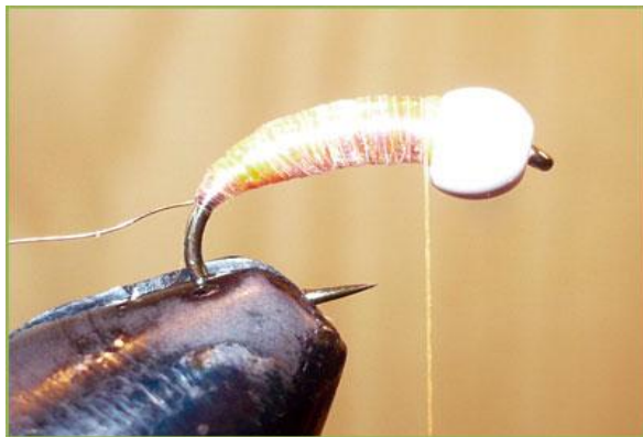
Etape 7 : attention là c'est délicat ! Enrouler le brin (ou un brin après l'autre si vous en avez mis deux) de cristal flash sur tout le corps en sdm (avant d'enrouler penser à mettre la soie de montage contre la bille, un nœud final est utile pour l'empêcher de glisser sur le corps).