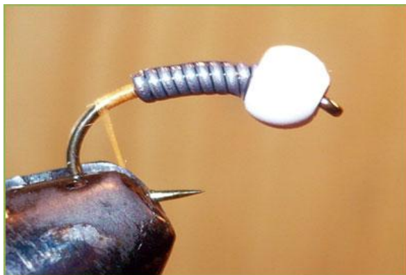
Etape 3 : fixer le fil de montage à l'arrière du plomb.