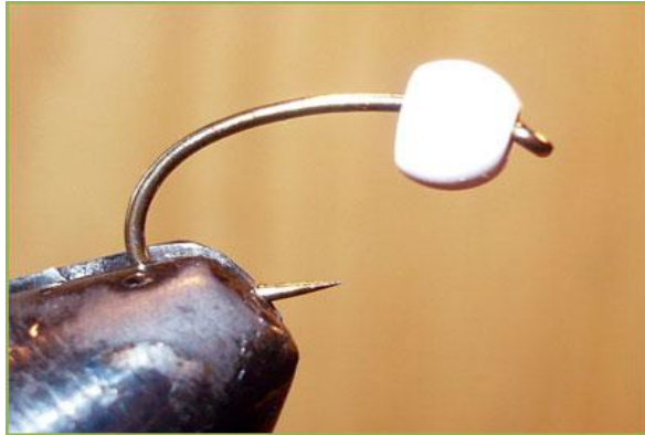
Etape 1 : enfiler la bille sur l'hameçon. Bien sur veillez à choisir une bille de taille adaptée.

Fil de cuivre fin Cristal flash ou équivalent rose ou nacre ou orange fluo Bille laiton ou tungstène blanche ou autre