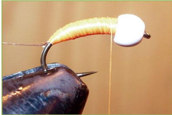
Etape 5 : avec la soie de montage, façonner un corps potelé.

Fil de cuivre fin Cristal flash ou équivalent rose ou nacre ou orange fluo Bille laiton ou tungstène blanche ou autre