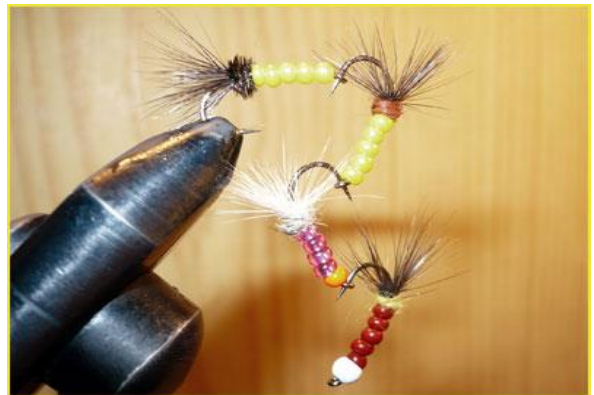
Etape 12 : plusieurs modèles redoutables sur truites et ombres. Notez qu'il est possible de lester fortement la mouche par ajout d'une bille.