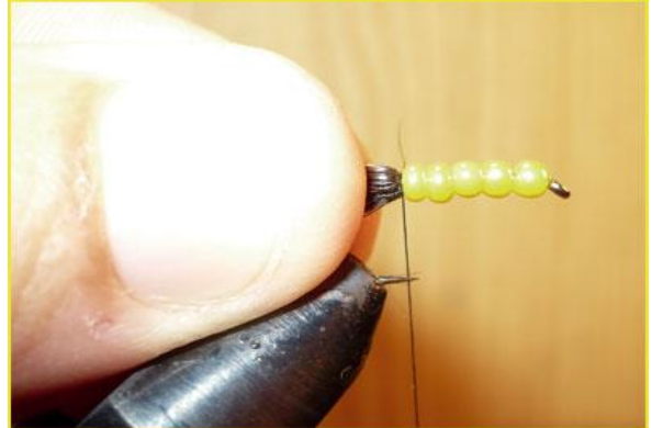
Etape 6 : prendre toutes les fibres entre les doigts et les rabattre vers l'arrière.