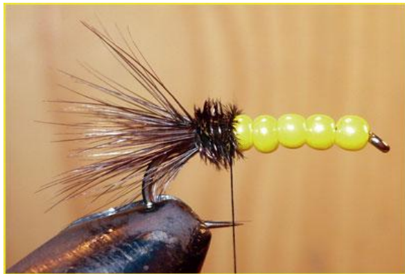
Etape 11 : tourner les herls jusqu'aux perles. Nœud final.