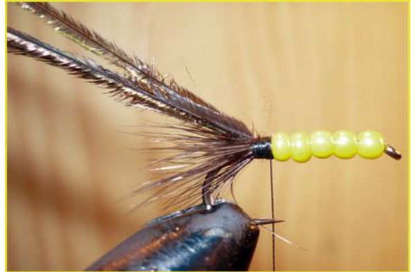
Etape 10 variante : à la place du dubbing, fixer deux herls de paon contre le hackle.