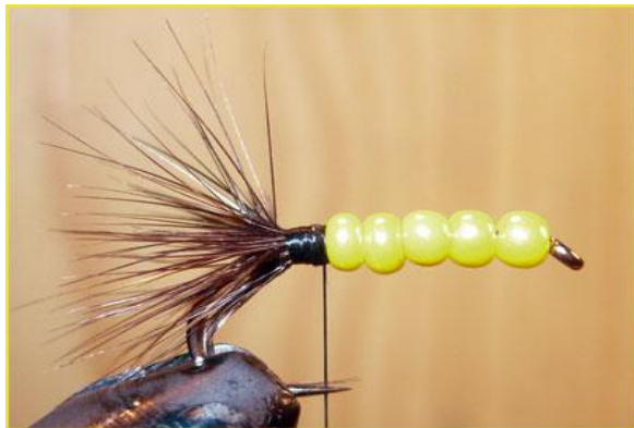
Etape 7 : avec la soie de montage passer plusieurs fois sur la base des fibres pour que celles-ci soient bloquées vers l'arrière.