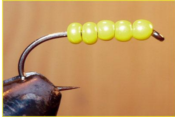
Etape 2 : enfilez les perles sur l'hameçon jusqu'à couvrir environ les trois quarts de la hampe.