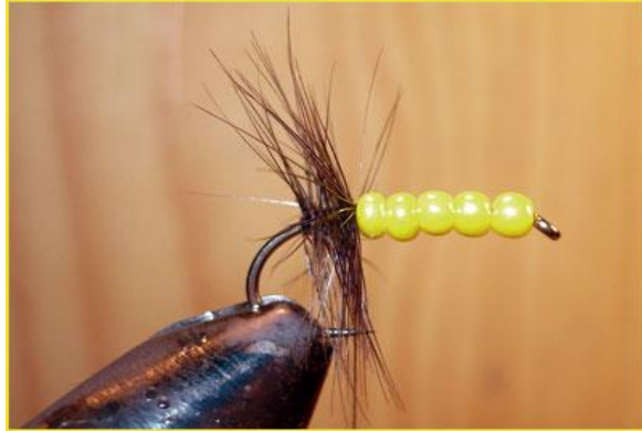
Etape 5 : tourner la plume - 4-5 tours- jusqu'aux perles.

Perles de verre pour collier toutes couleurs