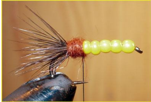
Etape 9 : tourner le dubbing sur la zone séparant hackle et perles. Faire le nœud final.

Perles de verre pour collier toutes couleurs