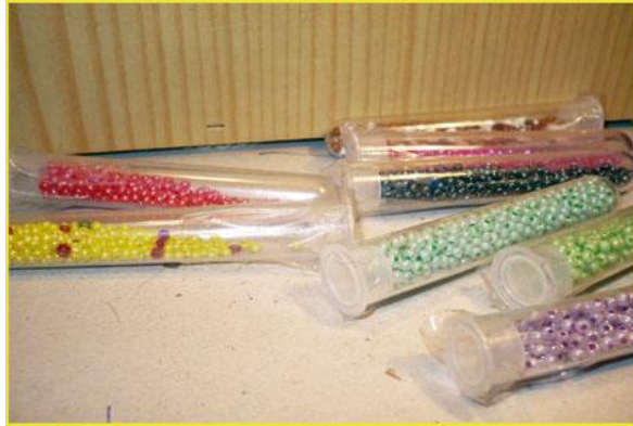
Etape 1 : on trouve de multiples couleurs pour les perles, faites votre choix.

Perles de verre pour collier toutes couleurs