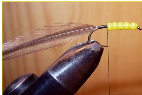
Etape 4 : fixer une plume de cou de coq (noire ici car la combinaison jaune/noir est ma préférée sur cette mouche) dont les fibres font environ 1,5 à 2 fois l'écartement hampe-pointe.