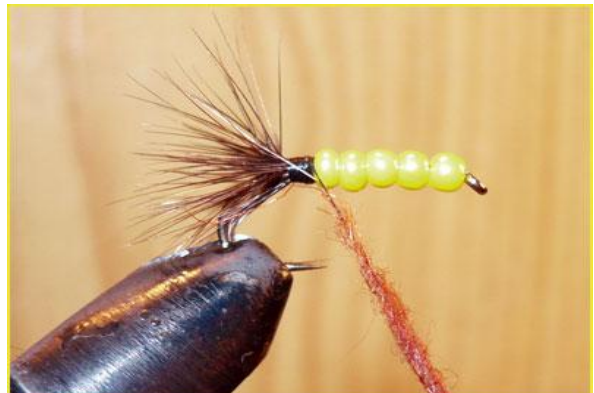
Etape 8 : préparer un dubbing de lièvre (rouille ici).